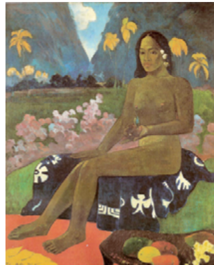
Tehura by Paul Gauguin. The seed of the Areoi, 1892

De ontwerpen van Spijkers en Spijkers zijn praktisch en modern tegelijkertijd en de draagbaarheid van de kleding is erg belangrijk. Daarbij willen Truus en Riet kleding ontwerpen voor jonge én oude vrouwen, zowel dik als dun en klein en groot. In dit filmpje is goed te zien hoe Spijkers en Spijkers een ontwerpen.