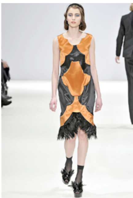
Spijkers en Spijkers herfst/winter 2012

De jaren twintig van de vorige eeuw zijn een grote inspiratiebron voor Spijkers en Spijkers. In deze jaren ontstaan allerlei nieuwe stromingen in de kunst, architectuur en design, zoals het modernisme , het surrealisme en de art deco . Vooral de geometrie van de art deco inspireert Spijkers en Spijkers en vormt de basis voor bijna al hun ontwerpen. In art deco worden alle afbeeldingen – van voorstellingen in de natuur tot mensen – geabstraheerd, ofwel door ze te stroomlijnen, ofwel door ze hoekig te maken. Onderwerpen als de opkomende zon, de ziggurat en de fontein lenen zich goed voor een dergelijke aanpak; ze worden de symbolen van de art deco genoemd. Deze simpele vormen worden weergegeven in heldere, primaire kleuren, die bij voorkeur contrasterend zijn. Vaak worden ze gebruikt in combinatie met zwart. Zilver, chroom en glas zijn populaire materialen om mee te werken.