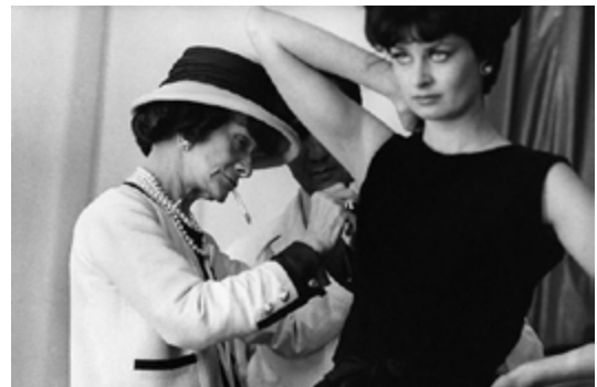
Coco Chanel werkt aan een "little black dress", 1926

Voor Spijkers en Spijkers is draagbaarheid van de kleding een belangrijk uitgangspunt. Het duo ontwerpt voor de moderne, onafhankelijke en actieve vrouw. De ontwerpen van Spijkers en Spijkers zijn, net als bij Chanel, praktisch. Zo hebben de jurken bijvoorbeeld zakken, een fenomeen dat rond de jaren twintig van de vorige eeuw pas haar intrede deed. Daarnaast zijn de ontwerpen vaak losjes om het lichaam gesneden: de moderne vrouw is immers altijd in beweging. Eerst wordt gekeken wat de functie van het kledingstuk is en dan pas volgt het ontwerp. Vergelijk dat eens met de Victoriase vrouwen die nauwelijks konden ademen en bewegen in hun korsetten en keurslijfjes.