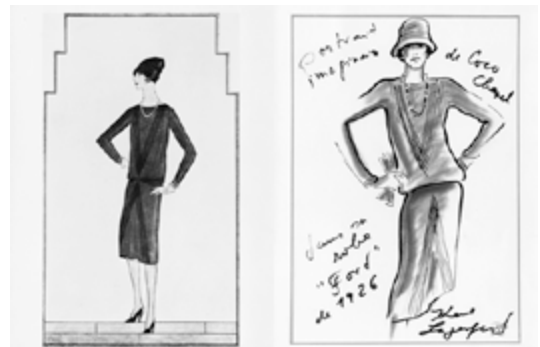
Ontwerptekening van Coco Chanel van een "little black dress", 1924