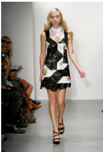
Where the Wild Roses Grow. lente/zomer 2011